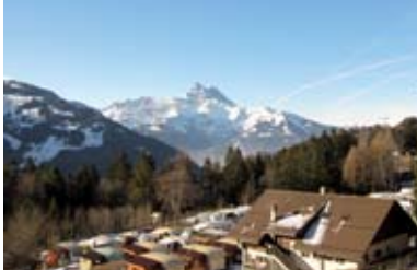
« Les Frassettes » – Villars-Gryon