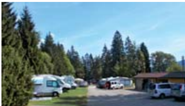
« Le Rocheray » – Le Sentier