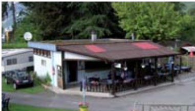
« Les Horizons Bleus » – Villeneuve